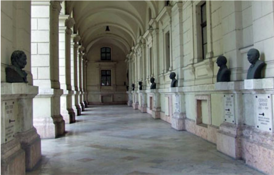
The long Arcades opposite the Parliament. The busts show the faces of Hungarian politicians