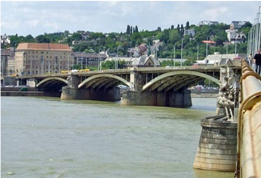
The Margit Bridge connects Buda and Pest across the Danube. It is the second northernmost and second oldest public bridge in Budapest.