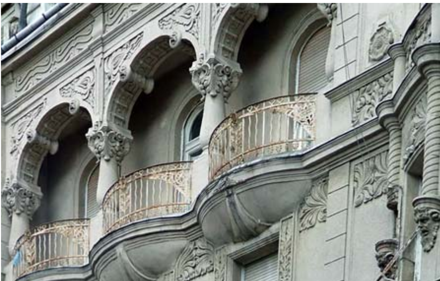
A balcony in Budapest showing a unique mixture of different styles

Budapest is a beautiful city with a lot of architectural treasures. Sometime influenced by Neo Renaissance, Neo Classicism, Neo Baroque and even ideas of Art Deco are spread all over the City.