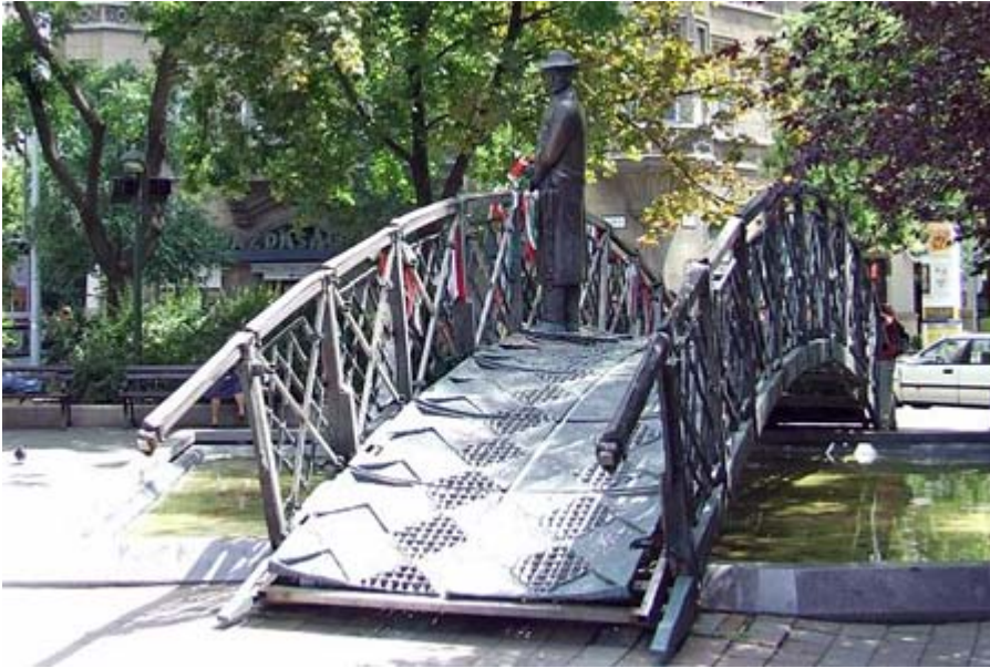
Walking in the direction of Falk Miksa you pass the famous "Man on a Bridge" monument

The man on the bridge is Imre Nagy (not a relative to László Nagy), martyr and prime minister of the Hungarian Revolution in 1956. He did not want to resign from his ministership, and because of this, János Kádár had him hanged (and killed thousands of Hungarians at the time).