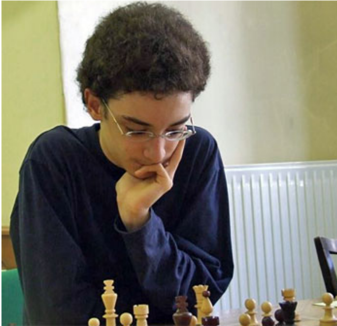
Fabiano finished first with 7.0/9 points and a performance of 2631

Fabiano Caruana was born on July 30th, 1992, in Miami Florida. He has American and Italian citizenship, but currently resides in Budapest, Hungary. Professional achievements: