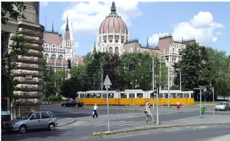
If you take the metro you arrive at the rear of the Hungarian Parliament